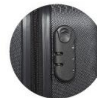
CANDADO DE COMBINACIÓN NUMÉRICA