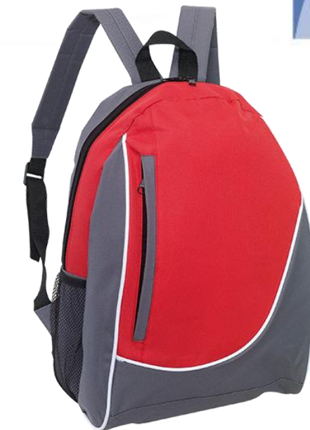
MOCHILA STREET COLORS CÓDIGO: C493

28,5 x 15 x 39,5 cm. Capacidad 18 litros aprox. Polyester 600D. Bolsillo frontal con cierre y vivos blancos. Un compartimento principal. Correas regulables y herrajes plásticos.