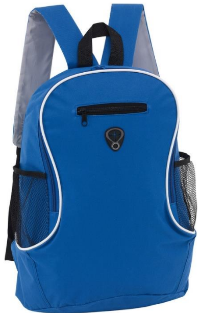
MOCHILA CÓDIGO: C491

40 x 29 x 17,5cm. Capacidad 16 litros. Aprox. POLYESTER 600D. Compartimento principal y pequeña bolsa frontal con cierre. 2 Bolsas laterales de red. Salida para audífonos.