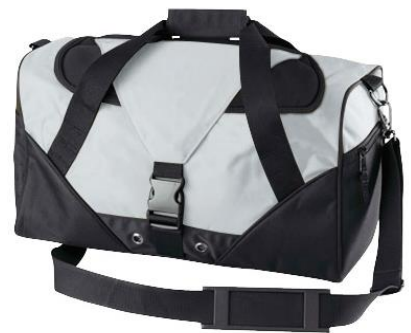
Bolso de Viaje CODIGO: VD15 53 x 27 x 20 cm. Bolso de viaje modelo "Journey" en tela raquelada polyester 600D.