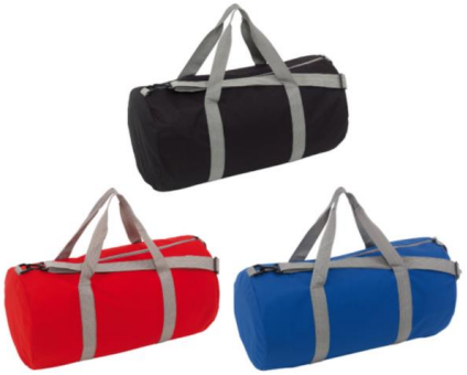
BOLSO DEPORTIVO "WORKOUT" CODIGO: C554 Ø28 x 55 cm. Polyester 600D. Bolso deportivo con espacioso compartimento principal con cierre, 2 asas, correa ajustable.