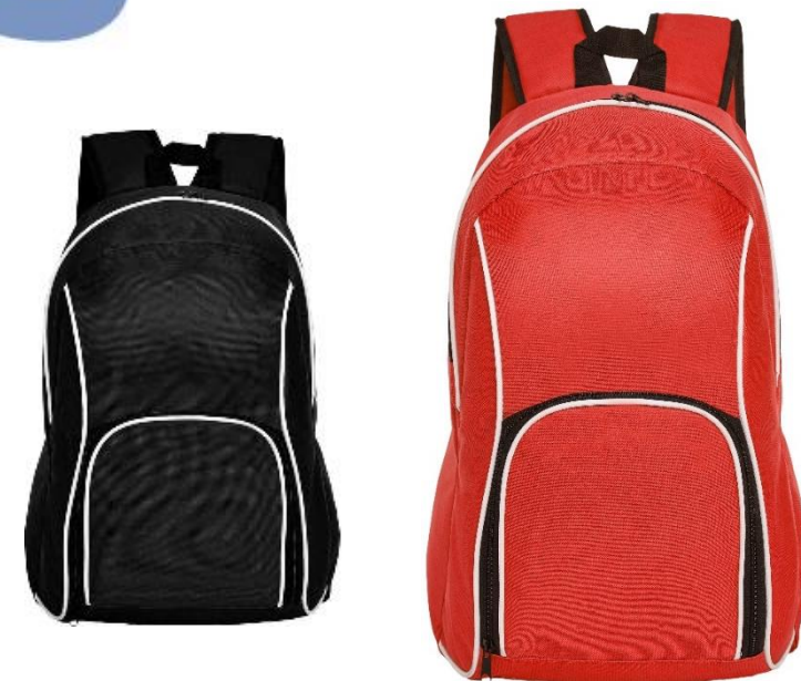
MOCHILA CÓDIGO: C502

43 x 32 x 13,5 cm. Capacidad 15 litros. Polyester 600D. Mochila con bolsillo frontal en la parte inferior, bordes blancos y parte interna acolchada. Correa ajustable y manillas acolchadas.