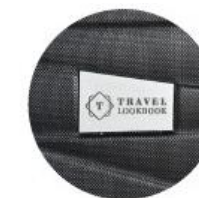
PLACA METÁLICA DESMONTABLE PARA GRABADO